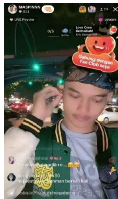
Gambar 2. Absen Love Oren