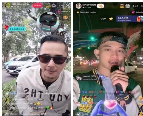
Gambar 3. Bentuk Apresiasi di Room Live