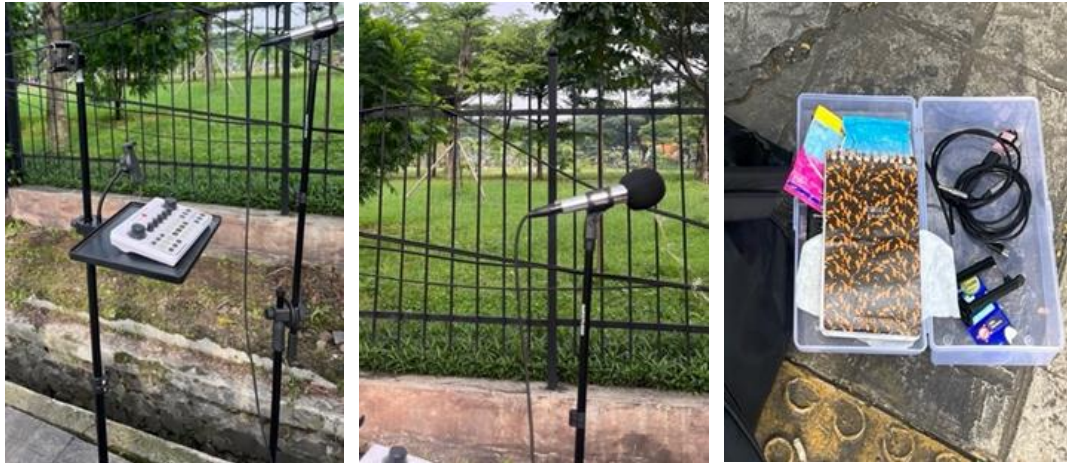
Gambar 2. Equipment Live streaming