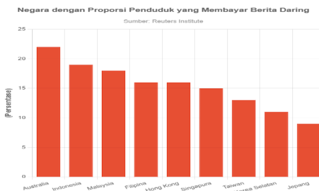
Gambar 1. Data Negara dengan Proporsi Penduduk yang Membayar Berita Daring

Berdasarkan data yang dirilis oleh Reuters Institute dalam Digital News Report pada tahun 2023 menyatakan bahwa masyarakat Indonesia menduduki peringkat kedua terbesar di Asia Pasifik dalam proporsi penduduk yang membayar berita di media online. Seperti media konvensional, media online juga menerapkan sistem berlangganan atau berbayar untuk memberikan akses rutin ke informasi.