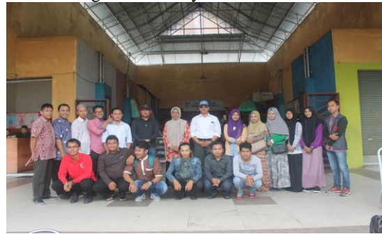
Gambar 2. Pengabdian dan Kepala Dinas Perindustrian dan Perdagangan kota Palangka Raya