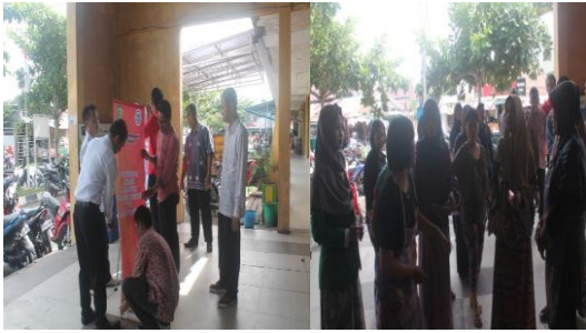
Gambar 3. Penyuluhan pentingnya tera ulang timbangan/sertifikasi timbangan