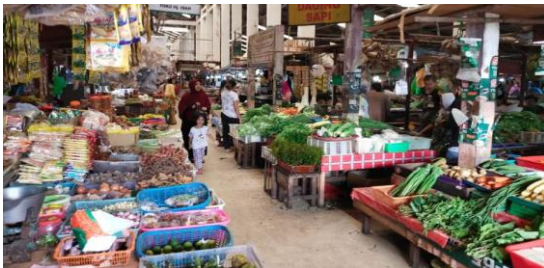
Gambar 1. Observasi Pengabdian di Pasar Kahayan