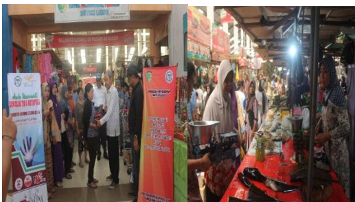
Gambar 4. Pembagian timbangan duduk/dacing tradisional