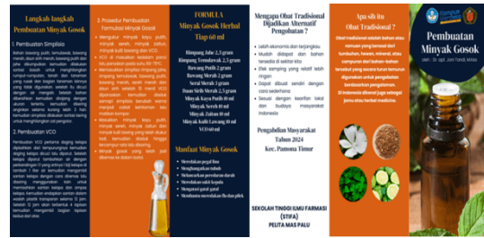
Gambar 2. Brosur Pembuatan Minyak Gosok Herbal

Pembuatan minyak gosok herbal memerlukan peralatan dasar seperti panci, saringan kain, spatula, baskom, dan kompor. Bahan-bahan terdiri dari 2 kategori utama: bahan minyak dan bahan simplisia (bahan kering). Bahan minyak yang digunakan meliputi minyak serai, minyak zaitun, minyak kayu putih, minyak kulit lawang dan minyak kelapa. Sementara untuk bahan simplisia mencakup beberapa tanaman dengan nama ilmiah mereka: kunyit, sirih merah, jahe, temulawak, bawang putih dan bawang merah (Tandi et al., 2023).