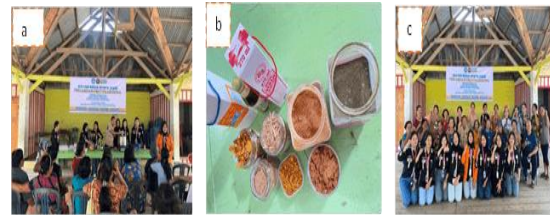
Gambar 3. (a) Suasana Pembuatan Minyak Gosok, (b) Bahan-bahan pembuatan minyak gosok, (c) Mahasiswa KKN dan Peserta yang mengikuti pegabdian

bahan-bahannya, yang memberikan sensasi pemanasan dan menyegarkan sambil merangsang sistem pembuluh darah, membantu mengubah asam laktat dalam tubuh menjadi ATP. Selain aplikasi kesehatannya, demonstrasi tersebut juga berfungsi untuk menginspirasi peluang kewirausahaan baru dengan memanfaatkan sumber daya alam Indonesia, terutama yang tersedia di lingkungan lokal. Inisiatif ini memiliki potensi untuk meningkatkan pendapatan ekonomi penduduk di Desa Petiro, Kabupaten Pamona Timur, Kabupaten Poso.