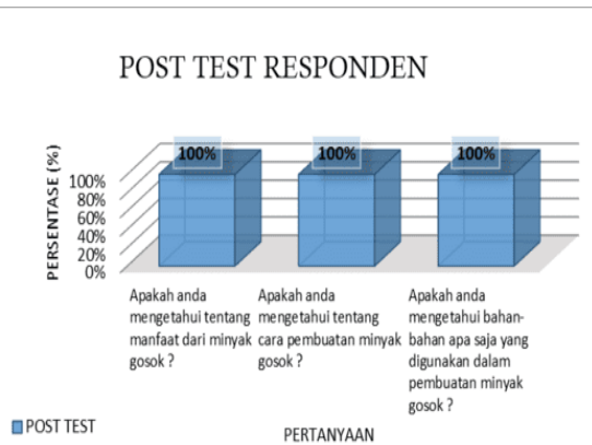
Gambar 4. Diagram hasil pre-tes dan post-test

Keberhasilan program ini menunjukkan bahwa masyarakat Desa Petiro memiliki antusiasme dan kemampuan yang baik dalam menyerap pengetahuan baru, khususnya dalam pembuatan produk herbal tradisional. Peningkatan pemahaman ini diharapkan dapat mendorong masyarakat untuk mengembangkan produksi minyak gosok herbal, baik untuk penggunaan pribadi maupun sebagai potensi usaha yang dapat meningkatkan perekonomian masyarakat desa.