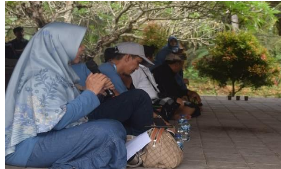
Gambar 2. Pemberian Materi mengenai Partisipasi Masyarakat Pengembangan Desa Wisata

Masyarakat sangat penting dalam mengembangkan desa wisata (Dewi, 2013). Mengembangkan sektor pariwisata adalah bagian dari konsep pariwisata untuk masyarakat, yang berarti bahwa penduduk desa harus mendapatkan keuntungan maksimal dari kemajuan pariwisata. Proses pengembangan sektor ini harus melibatkan penduduk desa secara langsung dalam aktivitas pariwisata (Inara et al., 2023). Penyediaan layanan dan jasa pariwisata adalah cara untuk mewujudkan partisipasi masyarakat. Memberdayakan masyarakat diharapkan akan berdampak positif pada aspek ekonomi, sosial, dan budaya masyarakat.