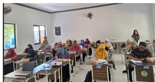
Gambar 6. Mengerjakan soal pos-tes