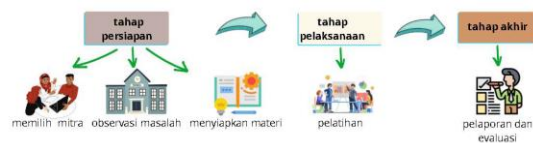
Gambar 1. Metode Pelaksanaan Pengabdian Kepada Masyarakat (Rochmawati, 2023)

Kegiatan Pengabdian Kepada Masyarakat ini diawali dengan kegiatan pemilihan mitra sampai pada tahap pelaporan. Untuk lebih lengkapnya dapat dilihat pada Gambar 1.