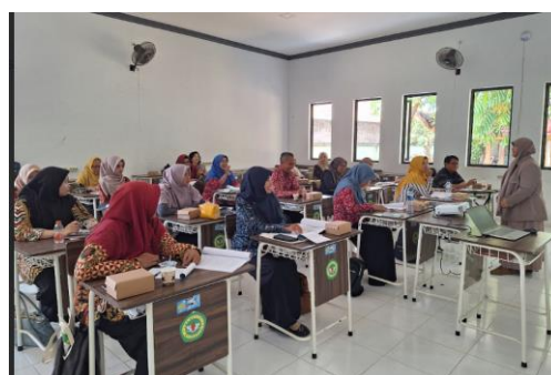
Gambar 5. Sesi diskusi dan tanya jawab