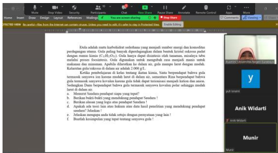
Gambar 9. Contoh soal evaluasi berbasis keterampilan argumentasi yang sudah tepat

Pada gambar 8 ini peserta mengembangkan soal evaluasi berbasis keterampilan argumentasi tetapi belum sesuai dengan TAP. Soal ini hanya memberikan fenomena dan tidak mempertanyakan setiap aspek dari TAP. Tidak ada dalam soal ini hal yang akan menjadi bahan sanggahan dalam berargumentasi. Selesai peserta presentasi, Tim PKM memberikan masukan perbaikan pada soal tersebut. Bahwa tidak semua soal yang meminta pendapat dengan kata bagaimana pendapat anda termasuk soal berbasis keterampilan argumentasi model TAP. Demikian pula soal yang hanya menggunakan kata jelaskan pendapat anda juga tidak selalu termasuk soal berbasis keterampilan argumentasi sesuai argumentasi TAP.