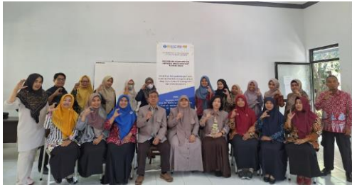
Gambar 7. Foto Bersama di akhir kegiatan sesi pertama

Hasil pre-tes dan pos-tes kemudian dianalisis dengan N-Gain score untuk mengetahui perkembangan pemahaman peserta setelah diberikan pelatihan. Peserta pelatihan diberikan soal yang menjawab pertanyaan argumentasi dan diminta membuat soal argumentasi. Hasil tes dianalisis nilai akhirnya dan level keterampilan argumentasinya. Hasilnya disajikan pada Tabel 4 dan Tabel 5.