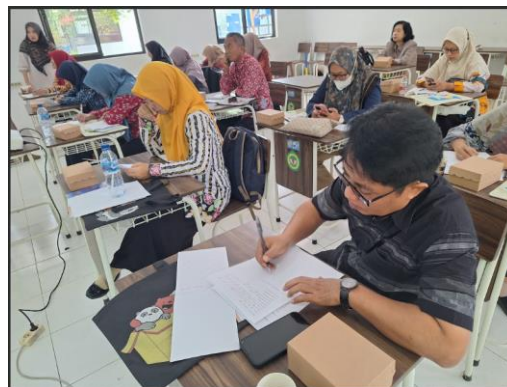
Gambar 3. Pemberian soal pre-tes