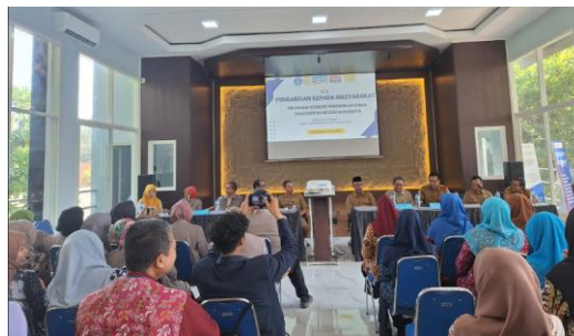
Gambar 2. Pembukaan PKM

Peserta sangat antusias memperhatikan pemberian materi ini. Berdasarkan hasil pra kegiatan PKM dimana Tim PKM menyebarkan angket menunjukkan bahwa sebagian guru belum mendapatkan materi pelatihan ini. Hal ini memberikan energi positif bagi Tim PKM untuk berbagi pengetahuan ini. Diskusi yang terjadi antara guru dengan Tim PKM sangat menarik, hingga waktu yang dijadwalkan dan disepakati di awal menjadi bertambah panjang. Ketika melihat peserta sangat antusias maka Tim PKM pun memberikan yang sebaik mungkin dapat diberikan. Terakhir diberikan postes untuk mengetahui serapan pengetahuan TAP peserta dan pemberian angket respon melalui google form . Berikut beberapa dokumentasi saat pelaksanaan pelatihan.