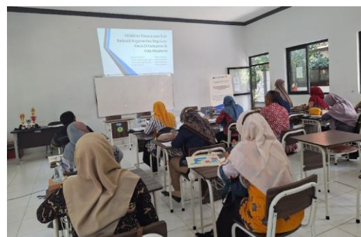
Gambar 4. Pemberian materi keterampilan argumentasi