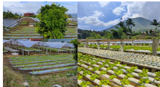
Gambar 2. Instalasi kit smart farming

Penerapan teknologi smart farming mampu mendeteksi dan mengumpulkan suhu, kelembapan udara dan kelembapan tanah secara berkala, pemantauan secara real time , akses pantau dan kontrol di mana pun dan kapan pun, pencahayaan manual dan otomatis sesuai dengan pengaturan, penyiraman manual dan Otomatis sesuai dengan pengaturan, pemantauan dengan visualisasi grafik, data sensor terakumulasi pada aplikasi Smart Farming.