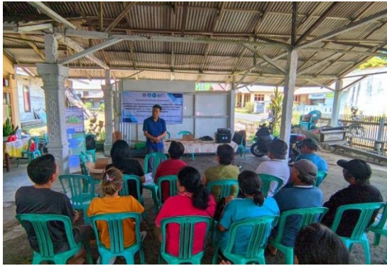
Gambar 7. Pelatihan strategi bisnis dan pemasaran digital