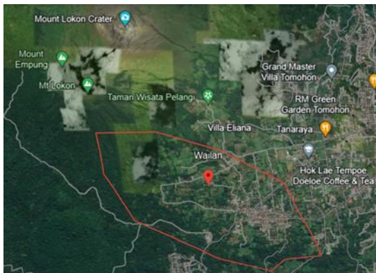
Gambar 1. Peta citra lokasi pengabdian kepada masyarakat, Kelurahan Wailan, Kota Tomohon

Kelurahan Wailan berada di bagian Utara Tomohon Kota Tomohon Sulawesi Utara, dengan luas wilayah Kelurahan Wailan adalah sekitar 450 Ha dengan jumlah penduduk 3.199 jiwa yang sebagian besar penduduknya adalah berprofesi sebagai petani (Damatun et al., 2017). Di Kelurahan Wailan ada 2 macam jenis usahatani yang di usahakan yaitu Padi sawah dan sayur-sayuran. Tanaman yang dihasilkan dari metode tanaman hortikultura pada rumah kaca ( Greenhouse ) diusahakan oleh sebagian besar petani di Kelurahan Wailan. Usahatani hortikultura juga sangat cocok di usahakan di kelurahan wailan karena didukung oleh letak geografis yang berada di lereng Gunung Lokon seperti pada gambar 1, tanaman hortikultura yang ditanam oleh petani di Kelurahan Wailan yaitu tanaman sayuran yang terdiri dari tanaman Cabai, Salada, Buncis, Caisin, Pitsai, Kol, dan Daun bawang (Yuda, 2023).