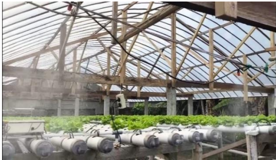
Gambar 4. Sistem smart farming pada tanaman greenhouse dengan teknologi penyiraman otomatis