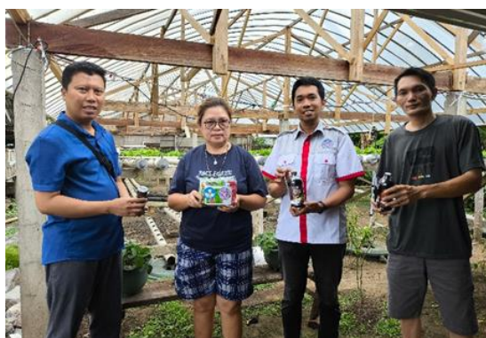
Gambar 8. Serah terima alat sistem smart farming dan perlengkapan pertanian