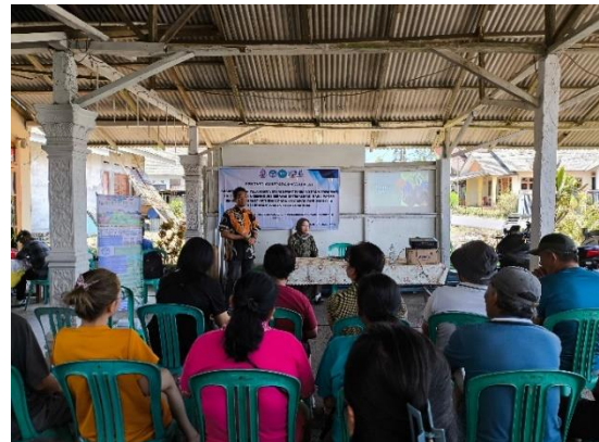
Gambar 5. Pelatihan sistem smart farming

farming secara mandiri. Hal ini mencerminkan peningkatan keterampilan teknis dalam menggunakan teknologi yang sebelumnya belum mereka kuasai.